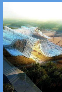
Il Padiglione cinese