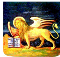
REGIONE DEL VENETO